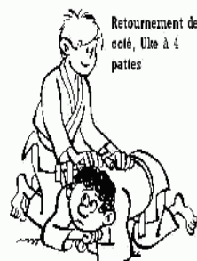
Retournement de côté, Uke à 4 pattes